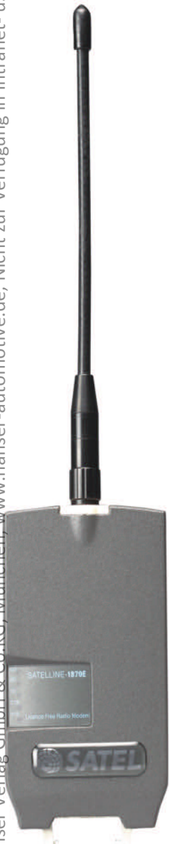
Bild 2: Gilt es Distanzen von einigen Kilometern zu überbrücken, ist Schmalbandfunk ideal geeignet z. B. das Datenfunkmodem Satelline-1870.

Precision Farming ist ein Schlagwort in der modernen Landwirtschaft: Mithilfe von GPS und einer ortsfesten Basisstation, die ein Korrektursignal aussendet, kann zentimetergenau gepflügt, gesät, gedüngt und geerntet werden. Das spart nicht nur Arbeitszeit, sondern auch Sprit, Düngemittel und Pestizide. Damit schon das Vorgehen die Umwelt und ermöglicht dem Konsumenten letztendlich den Zugang zu gesünderen Lebensmitteln. Weil sich beim Ernten ortsabhängig der Ertrag ermittelt lässt, kann man auch für den nächsten Pflanzzyklus